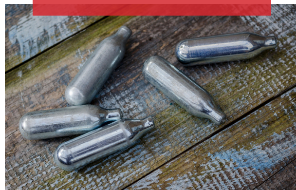
用作鲜奶油或食品喷雾推进剂的一氧化二氮，以大罐、小金属罐或充气弹形式展示。