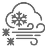
Tormenta de nieve