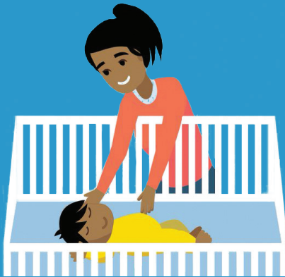
ጠንካራ የእንቅልፍ ወለል ይጠቀሙ