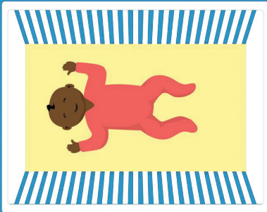
በሁሉም የእንቅልፍ ጊዜዎች እንዲተኛ ማድረግ